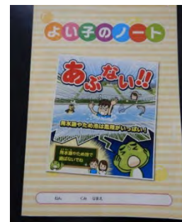
ノートの配布（北海道土地連）