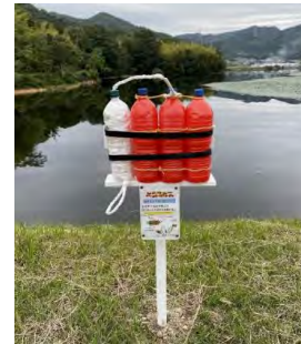
レスキューペットボトル設置