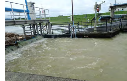
農業用の用排水路の増水状況

ため池の転落死亡事故は、釣り、水遊び等を行っているときに発生することが多くなっています。