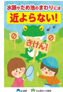
チラシの配布（新潟県）