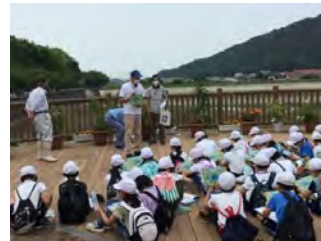
ため池学習の様子