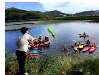
レスキューペットボトル発案