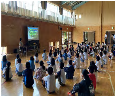
小学校での出前講座の様子