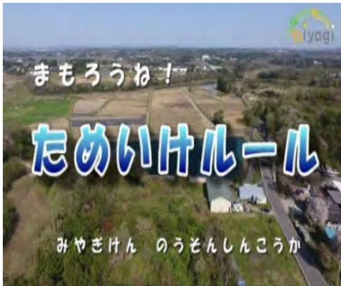
ため池事故防止・注意喚起動画