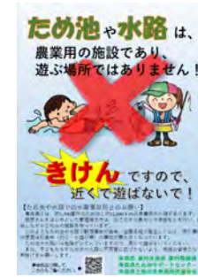
チラシの配布（青森県）